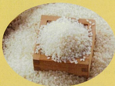
十日町産魚沼コシヒカリ